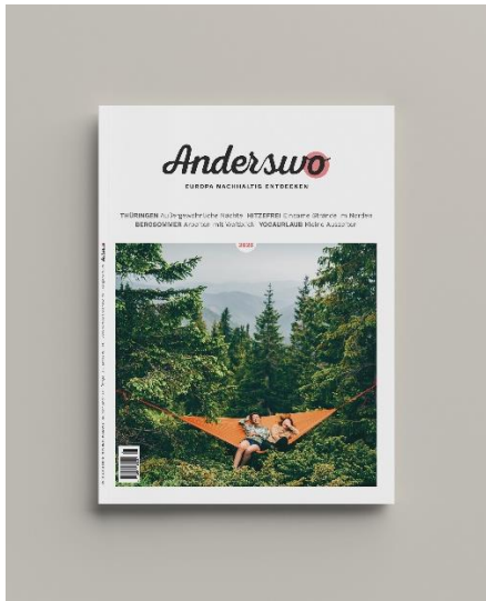
Zwei Menschen, eine Hängematte, die Natur als Dach über dem Kopf – mehr braucht es manchmal nicht zum Glück.