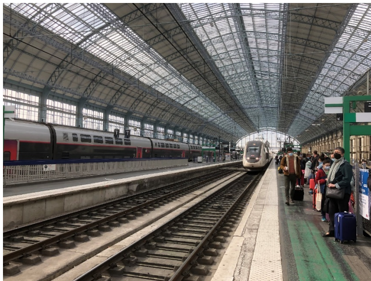
Bahnhof von Bordeaux